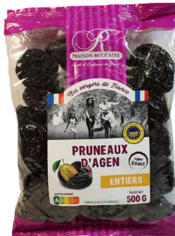
1 375g & 500g