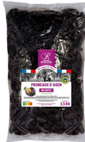
5 2,5 kg

Suggestion de présentation, visuel non contractuel.