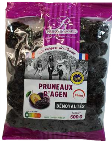
3 375g & 500g