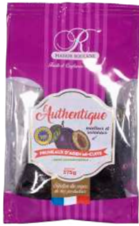
1 375g 4 coins