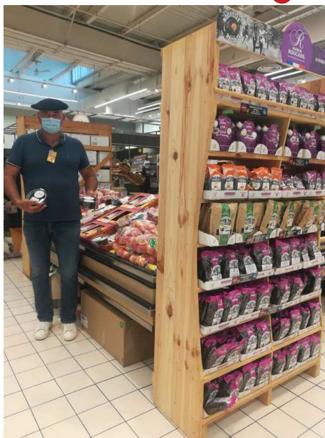
Animation 2021 pour le Mi-cuit de La St Luc avec un de nos producteurs