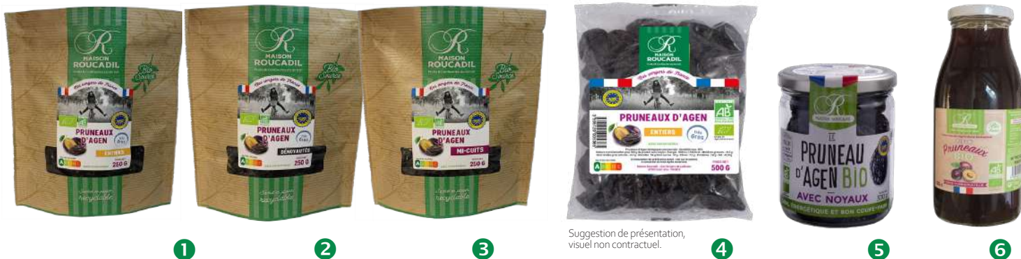
Suggestion de présentation, visuel non contractuel.