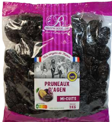
4 1 kg