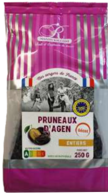
3 250g 4 coins