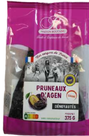
2 375g 4 coins