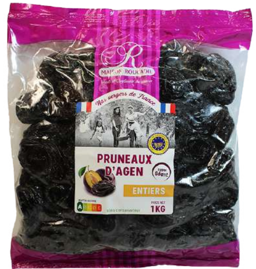
2 750g & 1kg