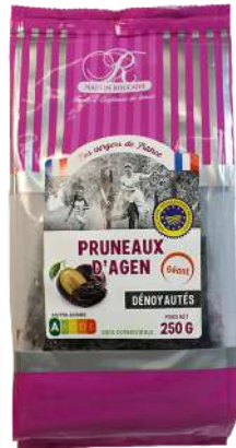
1 250g 4 coins