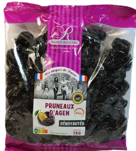
4 1 kg